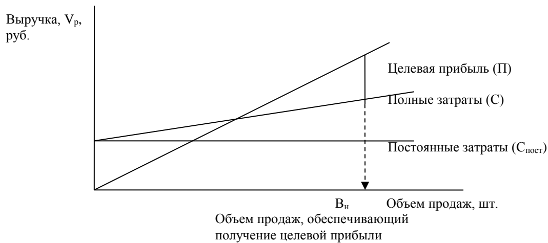
Рис.2. Определение объема продаж, обеспечивающего получение целевой прибыли при заданной цене реализации

Сбытовая политика. Опишите методы и каналы реализации разрабатываемого товара. Имеются ли у фирмы торговые представители, дистрибьюторы, собственные магазины и как будет организована работа с ними. Проанализируйте сравнительную эффективность различных методов реализации, включая специальную политику, касающуюся скидок, исключительных прав на распространение и т.п., в сравнении с тактикой ваших конкурентов в этой области.